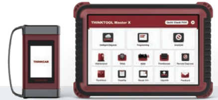
THINKTOOL Master X

■他社ADASターゲット紐付けライセンス : 89,760円(税込)(次年度以降の更新料不要)