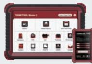
THINKTOOL MASTER 2