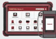
THINKTOOL MASTER X